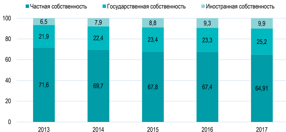
Рисунок 3. Товарооборот общественного питания в Республике Беларусь в 2013–2017 гг. по формам собственности, %

Кризис в развитии общественного питания в 2015–2017 годах привел к существенному перераспределению розничного товарооборота не только между регионами, но и по формам собственности. В результате доля частного сектора снизилась, а государственного и иностранного секторов – возросла. Это косвенное свидетельство разных условий хозяйствования, имеющих место в сфере общественного питания, что ярко проявилось в условиях кризиса общественного питания. При этом, по предварительным данным, доля индивидуальных предпринимателей в товарообороте общественного питания в последние годы заметно выросла, что говорит об их более высокой конкурентоспособности в сравнении с организациями торговли, но их вклад в товарооборот общественного питания остается в пределах статистической погрешности и не превышает 0,3%.